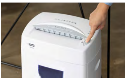
Función de inicio/parada automática y tecnología anti-atasco de papel.