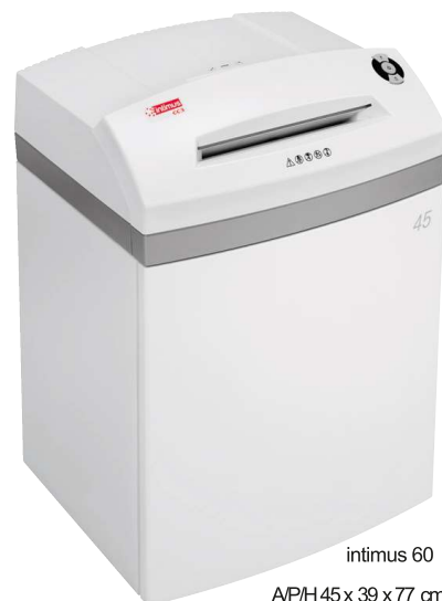
intimus 60 A/P/H 45 x 39 x 77 cm

Destruccion profesional – la síntesis entre tecnología, rendimiento y diseño. Todas las destructoras intimus® se fabrican empleando componentes duraderos y de alto rendimiento, diseñados para tener una larga vida útil con una elevada carga de trabajo. La gama de productos cubre todas las exigencias desde uso diario en oficinas hasta máquinas destructoras de alta seguridad que se utilizan para destruir material clasificado de conformidad con todas las normativas legales vigentes, como DIN66399 o NSA02/01. Las destructoras intimus® incorporan varias características que las hacen únicas en cuanto a facilidad de manejo y eficiencia de trabajo.