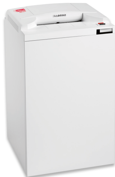
APH/49 x 44 x 90 cm

Destructoras profesionales – la síntesis entre tecnología, rendimiento y diseño. Todas las destructoras intimus® se fabrican empleando componentes duraderos, precisos y de alto rendimiento, diseñados para tener una larga vida útil con una elevada carga de trabajo. La gama de productos cubre todas las exigencias desde uso diario en oficinas hasta máquinas destructoras de alta seguridad que se utilizan para destruir material clasificado de conformidad con todas las normativas legales vigentes, como DIN 66399 o NSA 02/01. Las destructoras intimus® incorporan varias características que las hacen únicas en cuanto a facilidad de manejo y eficiencia de trabajo.